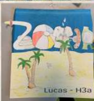
Lucas - H3a