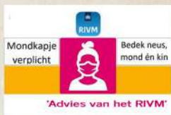
'Advies van het RIVM'

Voor u ligt de Havo Kerstkrant 2021! Het einde van een kalenderjaar is een mooi moment om terug te blikken op de afgelopen periode. Gezien mijn start als teamleider havo per 1 november is dat nog relatief kort. Ik heb het Hoeksch Lyceum leren kennen als een moderne school, waar docenten en ondersteunend personeel echt samen met elkaar en de leerlingen het onderwijs vormgeven. Er heerst een heel prettige cultuur, sfeer en leerklimaat!