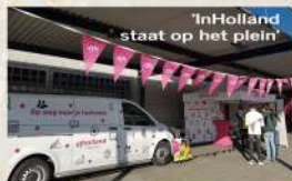
'InHolland staat op het plein'