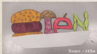
Sven - H3a

Opdracht Vorm en Letters : Tekenen de letters van een woord met de vormen van dat woord.