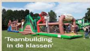
Teambuilding in de klassen'